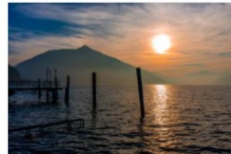
6_Ti presento il Mendrisiotto 2020_Giuseppe Cerro_Vista verso il Monte San Giorgio