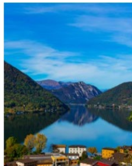
8_Ti presento il Mendrisiotto 2020_Giuseppe Cerro_Capolago