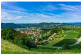
10_Ti presento il Mendrisiotto 2020_Giuseppe Cerro_Panorama sul Basso Mendrisiotto