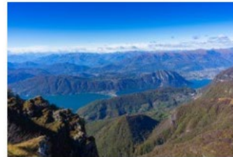
9_Ti presento il Mendrisiotto 2020_Panorama dal Monte Generoso