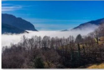
1_Ti presento il Mendrisiotto 2020_Giuseppe Cerro_Arogno