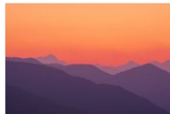
12_Ti presento il Mendrisiotto 2020_Giuseppe Cerro_Vista dal Serpiano Monte San Giorgio